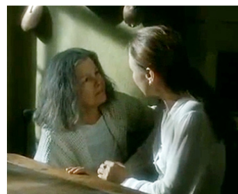
2005 MON PETIT DOIGT M'A DIT... de Pascal Thomas avec Catherine Frot