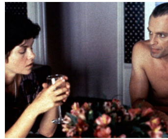
1984 CHOOSE ME (Choose me) d' Alan Rudolph avec Keith Carradine