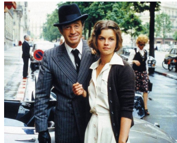
1975 L'INCORRIGIBLE de Philippe de Broca avec Jean-Paul Belmondo