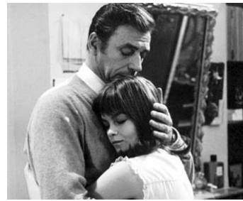
1966 LA GUERRE EST FINIE d'Alain Resnais avec Yves Montand