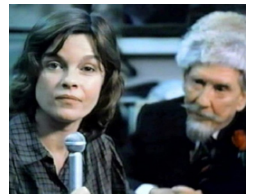
1980 LE DERNIER REPORTAGE (Final Assignment) de Paul Almond avec Burgess Meredith