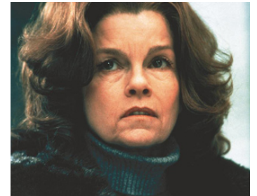
1999 LE VOYEUR (Eye of the Beholder) de Stephan Elliott