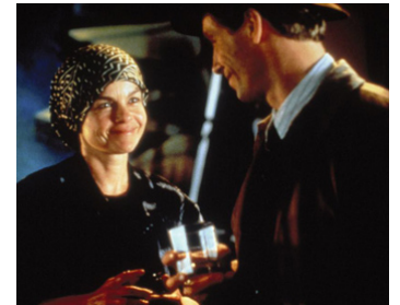
1988 LES MODERNES (The Moderns) d' Alan Rudolph avec Keith Carradine