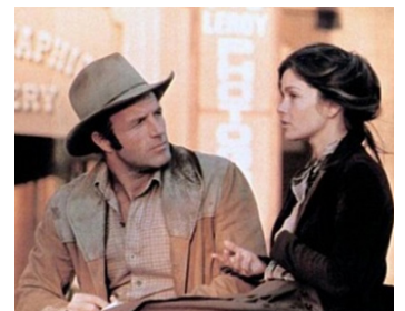
1977 UN AUTRE HOMME, UNE AUTRE CHANCE de Claude Lelouch avec James Caan