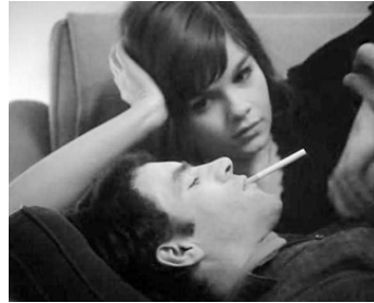
1967 ENTRE LA MER ET L'EAU DOUCE de Michel Brault avec Claude Gauthier