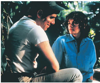
1980 LE DERNIER VOL DE L'ARCHE DE NOÉ (The last flight) de Ch. Jarrott avec Elliott Gould