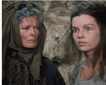
1971 LES TROYENNES (The Trojan Women) de M. Cacoyannis avec Katharine Hepburn