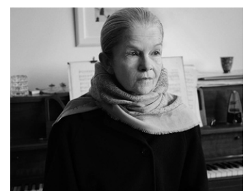
2015 CHORUS de François Delisle