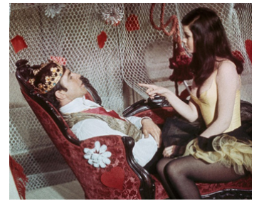
1966 LE ROI DE CŒUR de Philippe de Broca avec Alan Bates