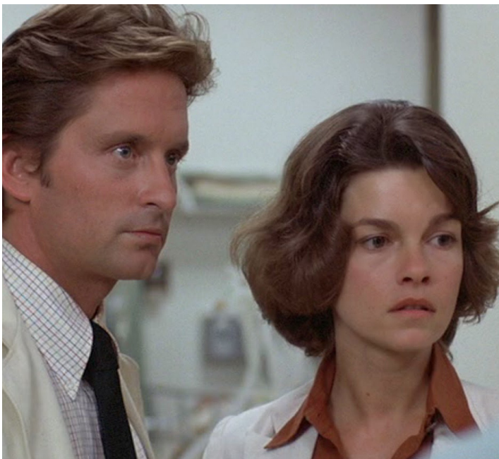
1978 MORTS SUSPECTES (Coma) de Michael Crichton avec Michael Douglas