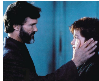
1985 WANDA'S CAFÉ (Trouble in Mind) d' Alan Rudolph avec Kris Kristofferson