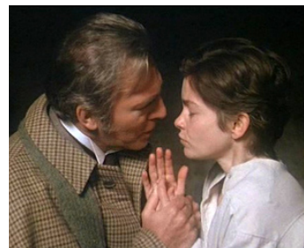
1978 MEURTRE PAR DÉCRET (Murder by Decree) de Bob Clark avec Christopher Plummer