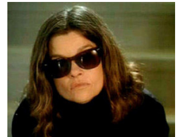
1994 MON AMIE MAX de Michel Brault