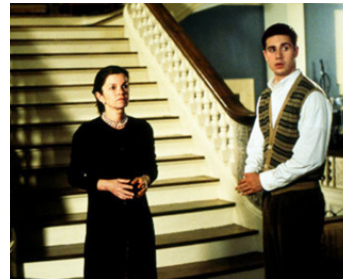
1997 THE HOUSE OF YES (The House of Yes) de Mark Waters avec Freddie Prinze Jr