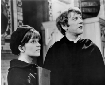
1970 ACTE DU CŒUR (The Act of the Heart) de Paul Almond avec Donald Sutherland