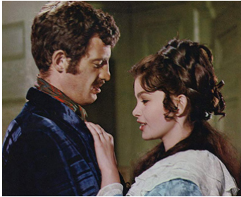
1967 LE VOLEUR de Louis Malle avec Jean-Paul Belmondo