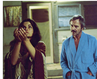
1976 ALEX OU LA LIBERTÉ (Alex & the Gypsy) de John Korty avec Jack Lemmon