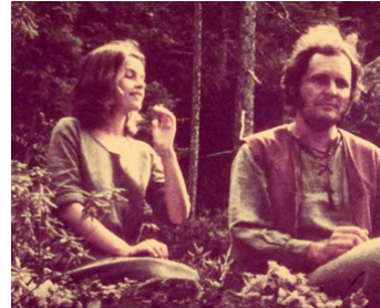
1972 JOURNEY (Journey) de Paul Almond avec John Vernon