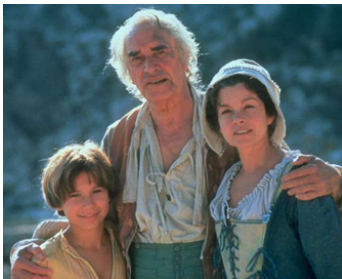
1996 PINOCCHIO (The Adv. of Pinocchio) de Steve Barron avec J. Taylor-Thomas, Martin Landau