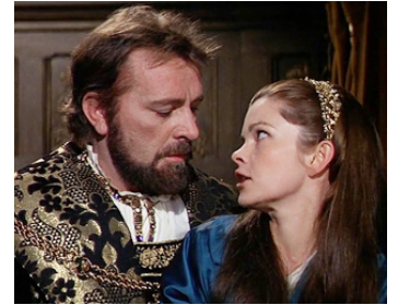
1969 ANNE DES MILLE JOURS (Anne of the thousand Days) de Ch. Jarrott avec R. Burton