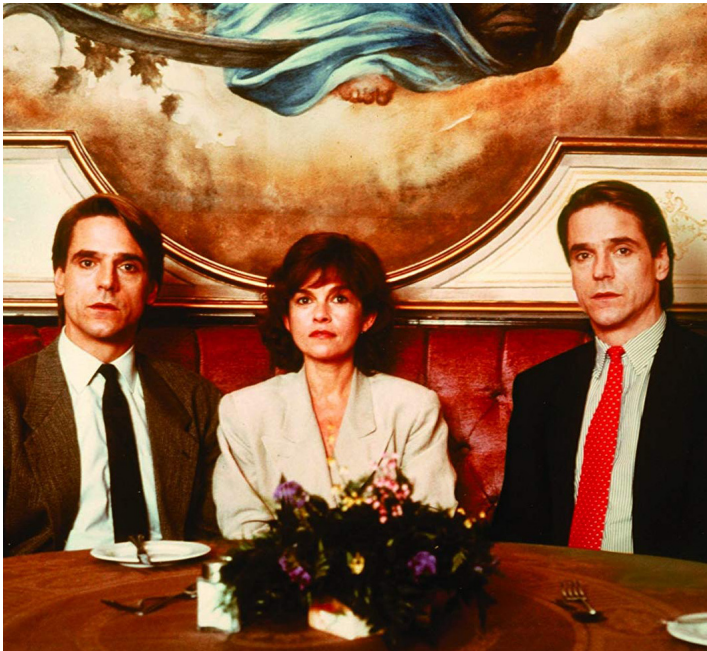
1988 FAUX-SEMBLANTS (Dead Ringers) de David Cronenberg avec Jeremy Irons