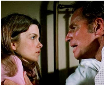
1974 TREMBLEMENT DE TERRE (Earthquake) de Mark Robson avec Charlton Heston