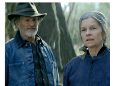
2006 DISAPPEARANCES (Disappearances) de Jay Craven avec Kris Kristofferson