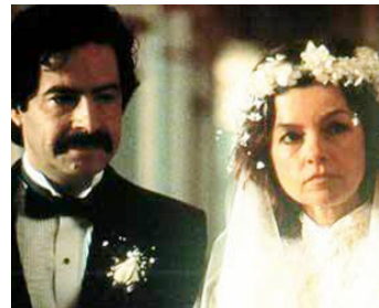
1990 LES NOCES DE PAPIER de Michel Brault avec Manuel Aranguiz