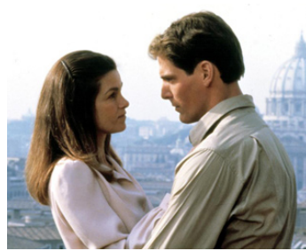
1982 MONSIGNORE (Monsignor) de Frank Perry avec Christopher Reeve