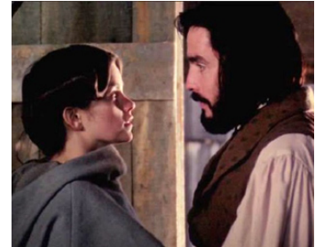
1973 KAMOURASKA de Claude Jutra avec Richard Jordan