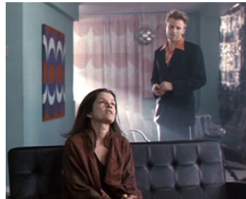
1997 LAST NIGHT (Last Night) de Don McKellar avec Callum Keith Rennie