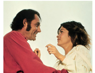
1976 LE PIRATE DES CARAÏBES (Swashbuckler) de James Goldstone