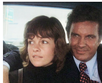
1976 OBSESSION (Obsession) de Brian De Palma avec Cliff Robertson