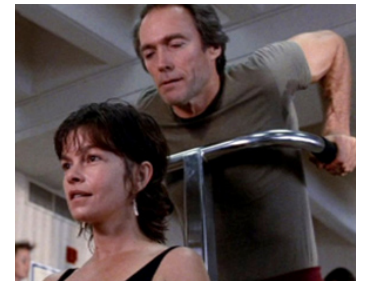
1984 LA CORDE RAIDE (Tightrope) de Richard Tuggle avec Clint Eastwood